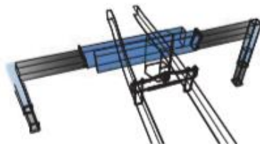
DẠNG CHẶN CHỐNG CHÉO (DÒNG ZE360)